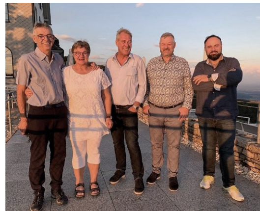
Der Vorstand vergnügt in der Abendsonne auf dem Weissenstein an unserer letzten Tagung.