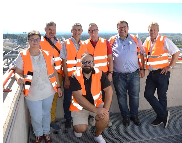
Der Vorstand auf dem Dach der renergia

Der Vorstand wünscht allen SVGP - Mitgliedern, unsern Gönner und Freunde und dem VGP, dass alle gesund bleiben und es privat und auch beruflich gut geht.