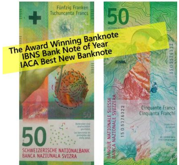
Aber die Anstrengungen haben sich gelohnt.

So entsteht ein Notenpapier mit der Taktilität vom gewohnten Papier und den Haltbarkeitsvorteilen einer Polymernote. Die Herstellung wie auch der Druck dieser Noten ist eine hochkomplexe Angelegenheit zumal auch die sehr hoch angesetzten Spezifikationen und Designwünsche mitunter zu Verzögerungen geführt haben.