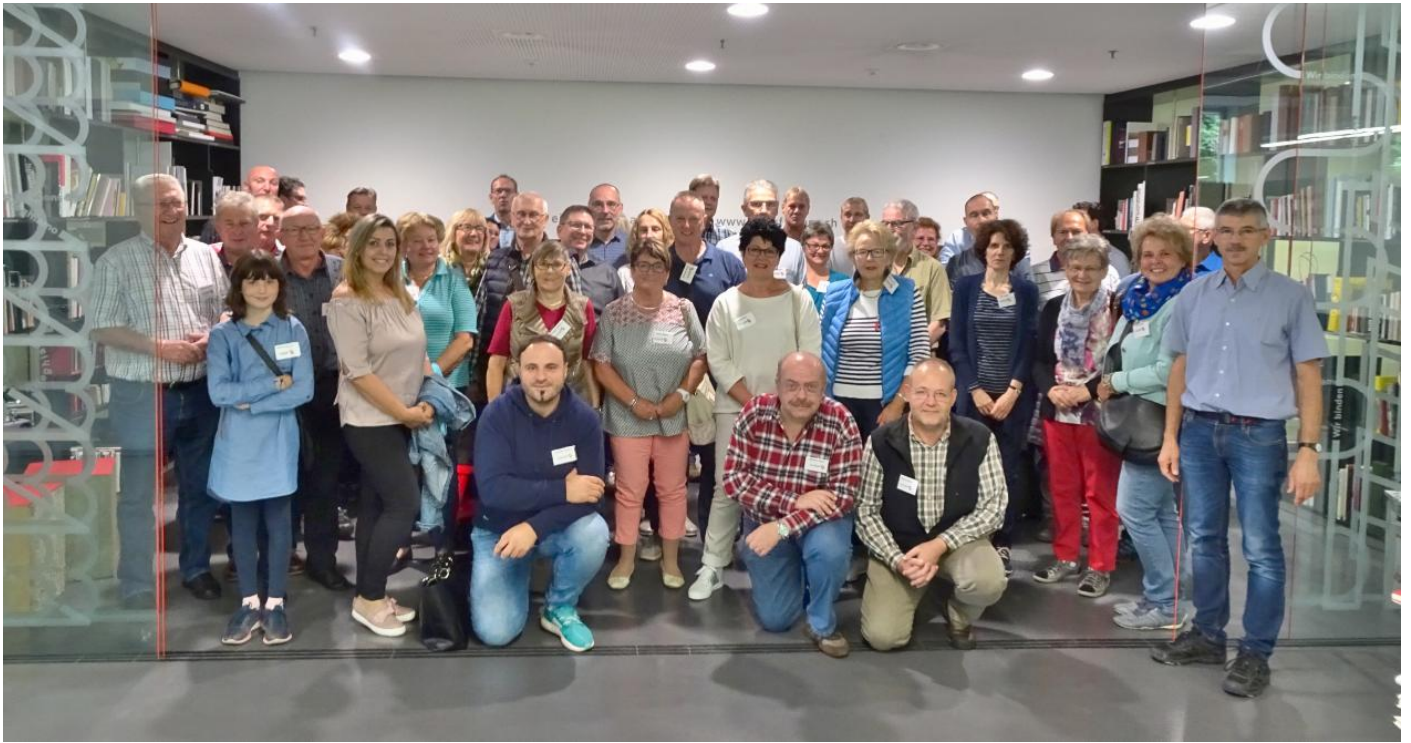
SVGP-Teilnehmer im Ausstellungsraum der Firma bubu (Burkhard Buchbinderei) in Mönchaltorf